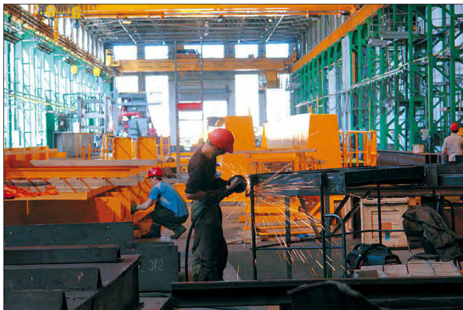
Здесь нет мелочей: деталям - особое внимание