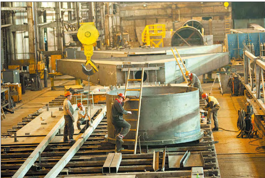
В цехе металлоконструкций кипит работа

С августа 2005 года основным акционером ПАО «Запорожжкран» стала финская транснациональная